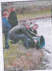
100 kg de gardons ont été mis à l'eau.

Le comité d'animation et pêche de Saint-Loup-du-Dorat a procédé à un rempoissonnement de l'étang communal. 100 kg de gardons ont