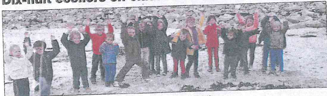
Les élèves ont approvoisé l'univers de la mer durant leur séjour dans la Finistère.

Dix-huit élèves de la petite section au CE1, encadrés par trois accompagnateurs, se sont rendus en classe de mer du 2 au 5 octobre. Le groupe a pris la destination du centre PEP Kervael à Primel-Trégastel (29). De nombreuses