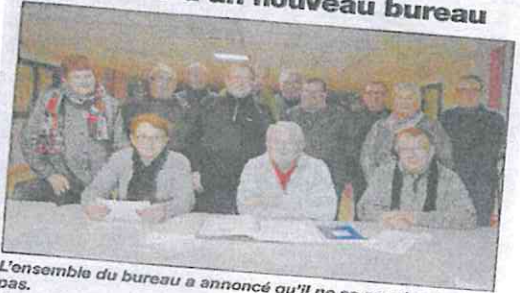
L'ensemble du bureau a annoncé qu'il ne se représentait pas.