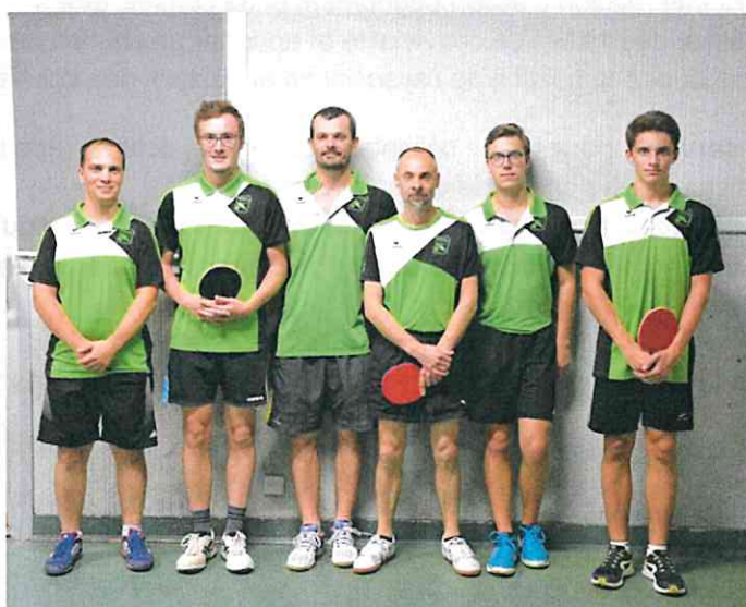
Équipe Super D2 2017-2018

Meilleurs Vœux de Santé Bonheur et Réussite pour 2018 à tous !!!