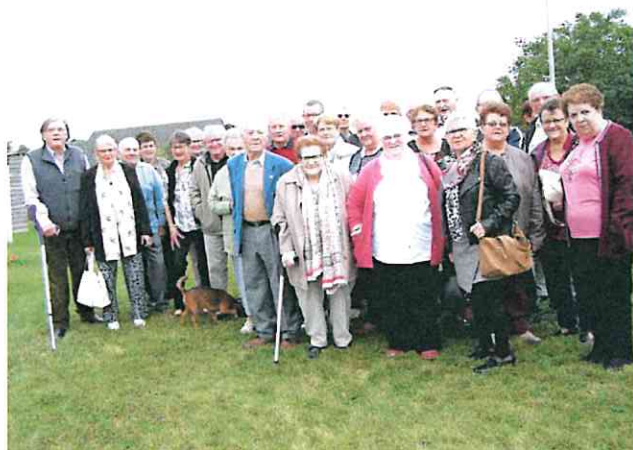
Le groupe lors de notre repas annuel du 28 septembre

Cette année, notre repas annuel nous a à nouveau été servi au Rond-Point. Trente-deux personnes y ont participé dans une excellente ambiance.