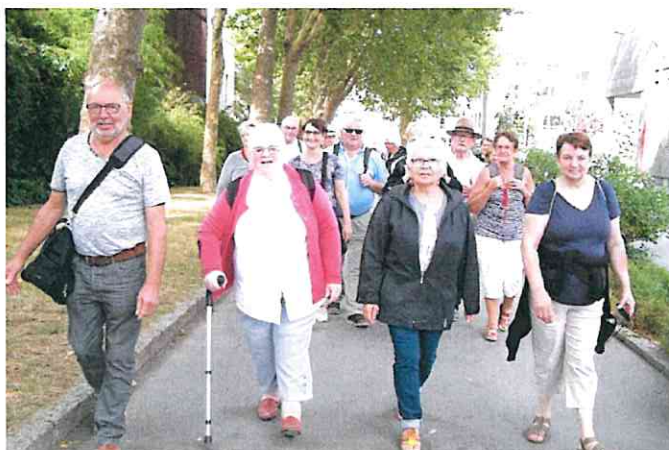
Notre groupe au festival de Lorient le 6 août

Notre sortie du 6 août à Lorient a également été une grande réussite puisque ce sont plus de 30 personnes de St Loup et des environs qui ont bénéficié de cette belle journée bretonne.