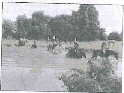
Ami des chevaux, cet été est pour vous !

Cet été, le centre équestre prévoit différentes activités. Du 17 au 20 juillet et du 14 au 18 août des mini camps sont proposés aux enfants de 7 à 14 ans. Au programme : balades, jeux, obstacles, batnade à cheval, calèche... Une immersion totale pour découvrir l'équitation ou se perfectionner. Des stages à la demi journée sont aussi possible du 1 er au 5 août.