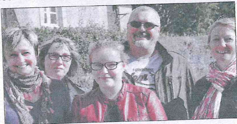
L'équipe de l'école George-Sand au complet.