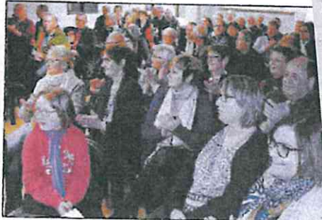
Les Lupidoratois nombreux à la cérémonie des vœux.

dez-vous. Des travaux ont été réalisés à l'église. Deux parcelles ont été vendues dans le lotissement des Peupliers. Il en reste une à vendre au tarif de 34€ le m 2 HT.