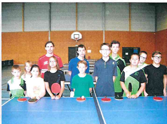
Photo de groupe au stage